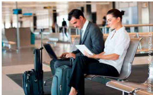
I passeggeri dell'UE beneficiano di un insieme minimo di diritti, tra i quali informazione, assistenza e misure di risarcimento in caso di annullamenti o forti ritardi

o forti ritardi. Anche le persone con disabilità o a mobilità ridotta sono tutelate dalle norme dell'UE sui diritti dei passeggeri.